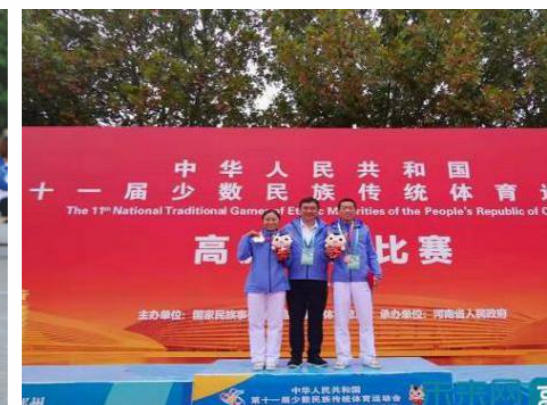
湖北民族大学学子在全国少数民族传统体育运动中获4枚金牌