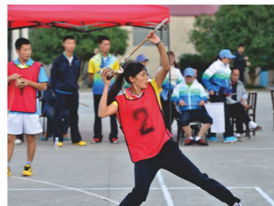
民族体育项目-陀螺