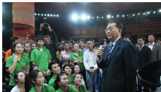
受到党和国家领导人李长春亲切接见