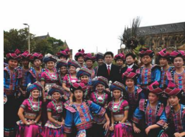
我校师生参加澳大利亚2010春节巡演