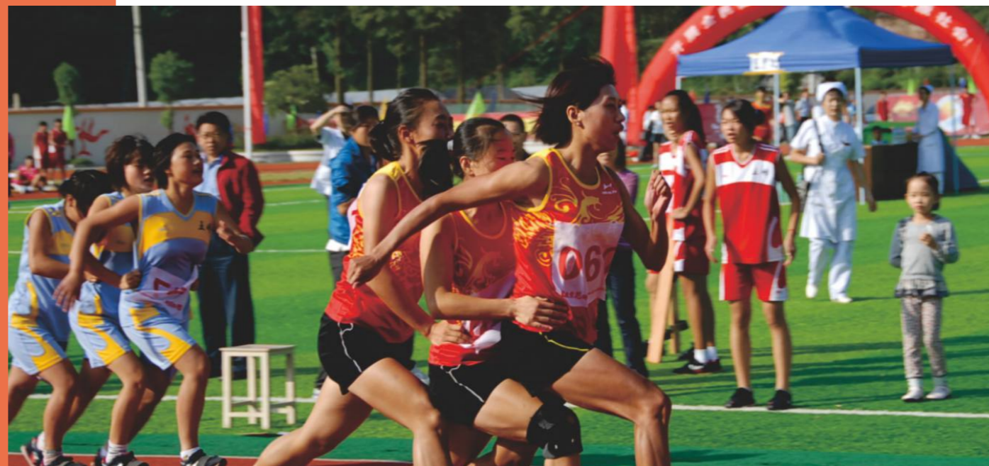
民族特色体育项目-板鞋 ▲

湖北民族大学长期致力于少数民族传统体育项目的挖掘、整理、教学及训练工作。各民族通过民族体育这一桥梁相聚于此，传承民族文化瑰宝，弘扬民族体育精神。我校体育生学习认真、训练刻苦，个个身怀绝技，也因此能够在各类全国级、省级民族体育大赛上，凭绝对实力大放光彩。