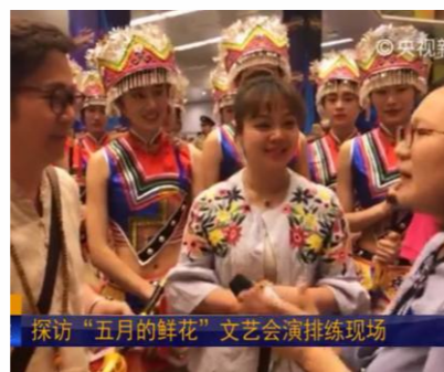
接受央视记者采访