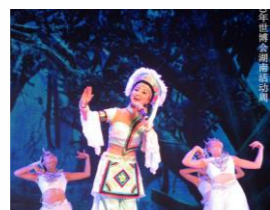
“土苗兄妹”组合参加上海世博会开幕式