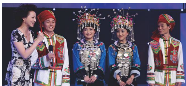
我校师生“土苗兄妹组合”参加cctv第十二届青歌赛获得原生态唱法金奖