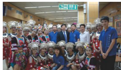
吴建清和恩施州州长刘方震看望演出师生