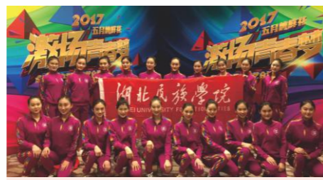
央视1号演播大厅门前合影