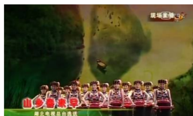
我校师生亮相中央电视台2009年春节联欢晚会